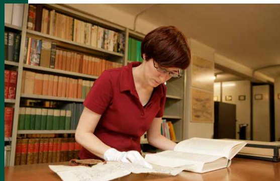
Kultur und Bildung

Mit Förderbeiträgen an Projekte aus Kultur, Bildung, Soziales, Gesundheit und Natur leistet die Ortsbürgergemeinde einen wichtigen Beitrag für ein vielfältiges kulturelles und gesellschaftliches Leben in der Stadt St.Gallen. Der Geschäftsbereich Mandate betreut diverse Stiftungen und Fonds sowie Kulturinstitutionen.