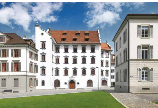
Stadthaus der Ortsbürgergemeinde

Veranstaltungen wie zum Beispiel Stadthauskonzerte oder 1. Augustfeier