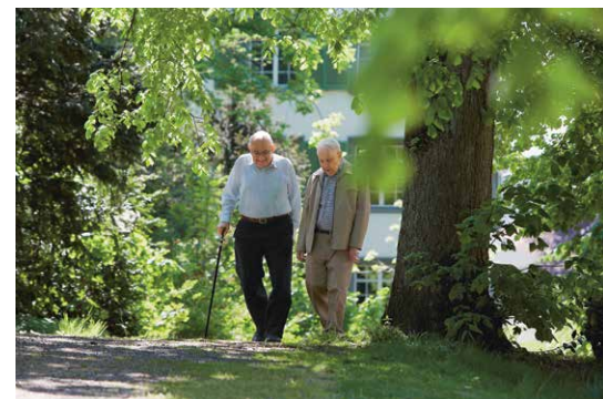
Kompetenzzentrum Gesundheit und Alter