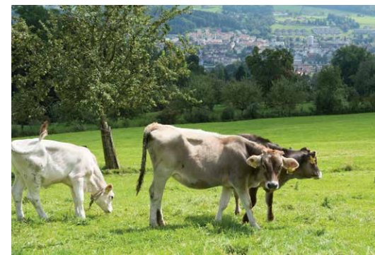
Leben im Grünen Ring